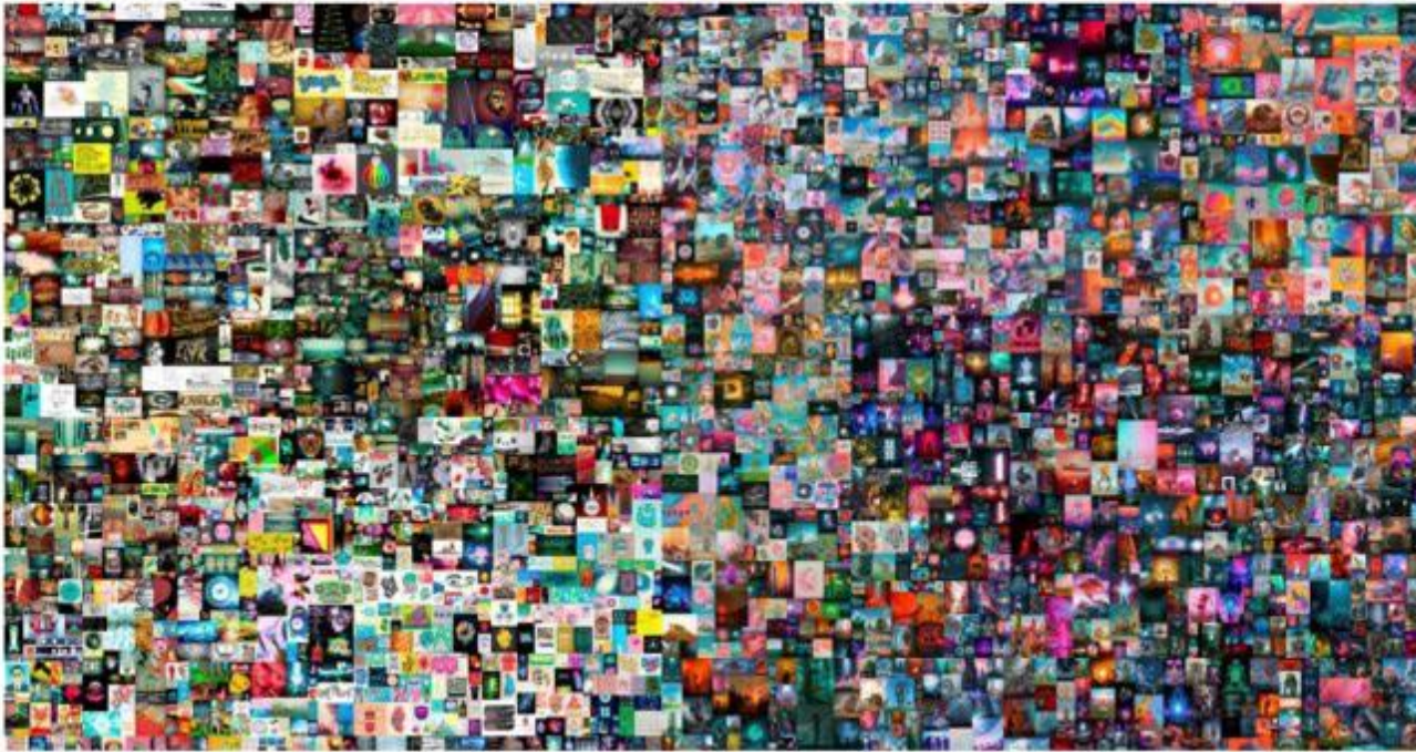
"Everydays — The First 5000 Days"

Esto se lleva a cabo al ofrecer autenticidad y propiedad a los archivos digitales y sus creadores/compradores.