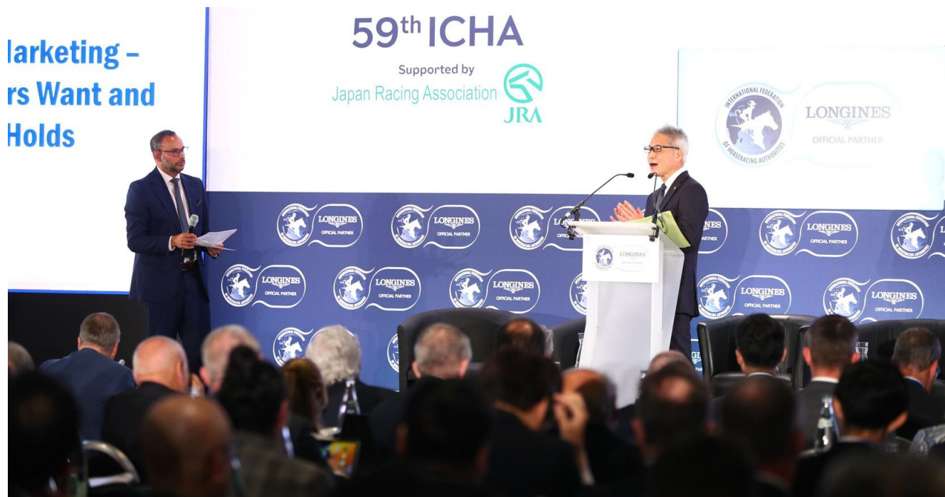
La ICHA convocó a 165 delegados de alrededor de 40 países

La primera Conferencia Internacional de Autoridades Hípicas fue organizada por la Société d'Encouragement en París, Francia, el 9 de octubre de 1967. Desde 1994, la conferencia anual está a cargo de la IFHA. La JRA es el socio oficial de la Conferencia desde 2021.