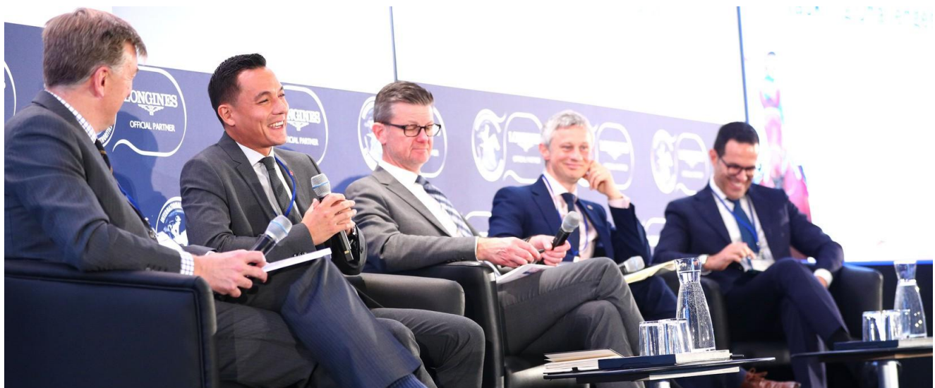
Sesión 2: Crecimiento del mercado de apuestas ilegales y cómo abordar los desafíos en la regulación de las apuestas.