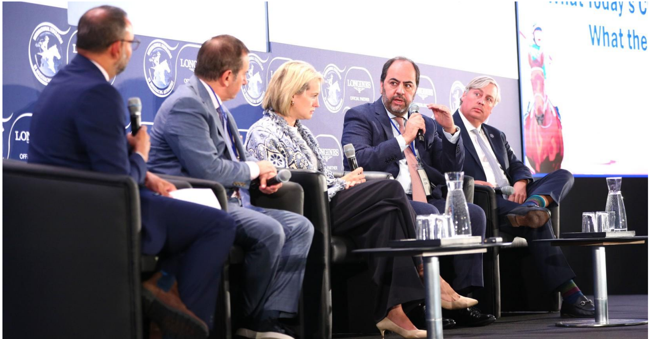
Sesión 1: Apuestas y marketing hípico: qué buscan los clientes de hoy y qué les depara el futuro.