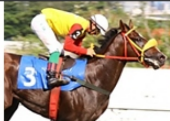
10 - PAINT NAIF