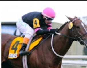
9 - QUIZ KID (ARG)