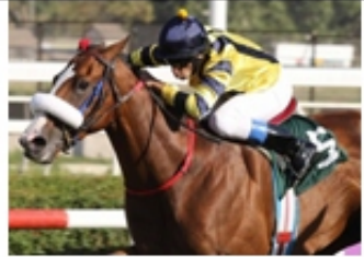
6 - PORTO FINO (CHI)