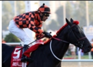
11 - RIO ALLIPEN (CHI)