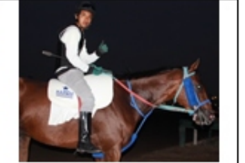
8- SENSACIONALE (USA) ppr PER