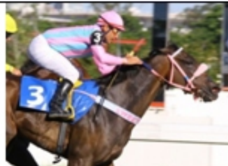
3 - ENERGIA GAROA (BRZ)