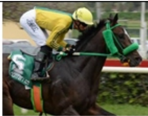
1- STREET LOLO (ARG) ppr PER