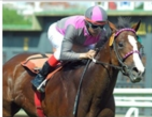
5 - HARLAN'S BLUE (ARG)