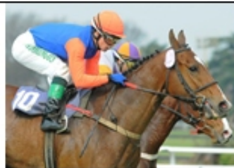
2 - DON INC (ARG)