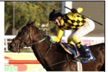
4 - FLYER (CHI)