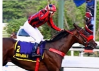
7 - UNIVERSAL LAW (BRZ)